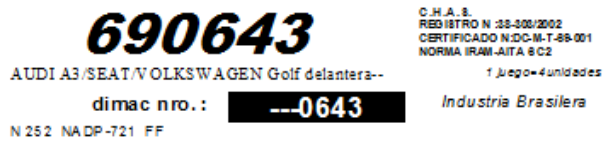
Lista de Precios